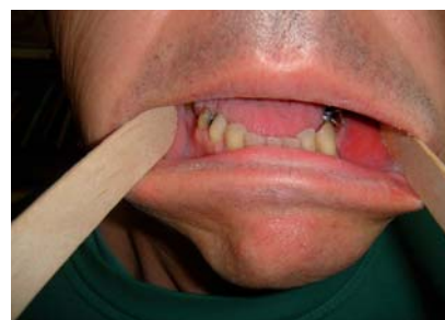
Figure 1. Tuméfaction muqueuse gauche

L'examen exobuccal recherche des signes cutanés d'infection. L'inspection et la palpation digitale endobuccales recherche une collection, souple, circonscrite, plus ou moins fluctuante, avec un possible écoule-