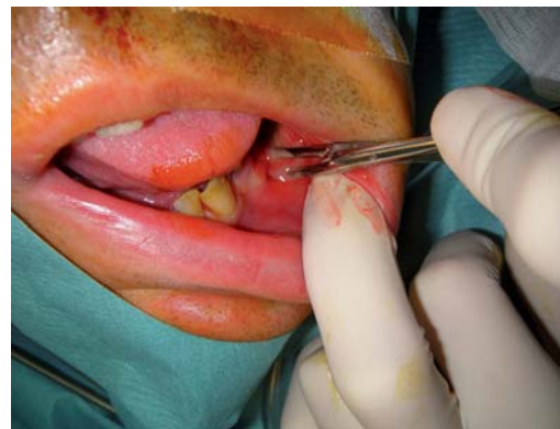
Figure 5. Discision effondrant les cloisons © Pr Thierry G.