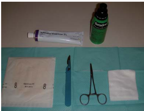
Figure 3. matériel nécessaire.

La mise à plat de l'abcès constitue le traitement symptomatique.