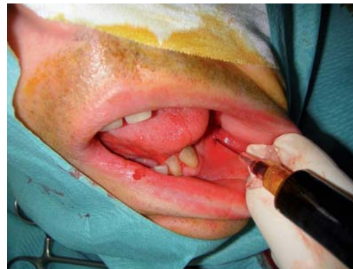
Figure 6. désinfection par Bétadine verte