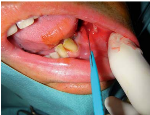
Figure 4. incision de l'abcès.